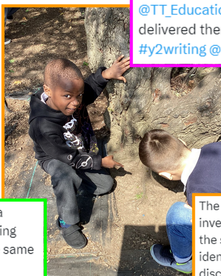
The Year 1 children have been using their investigation skills to explore trees around the school grounds. The children had to identify the different parts of the tree and discuss whether they were evergreen or deciduous trees. Great work Year 1!